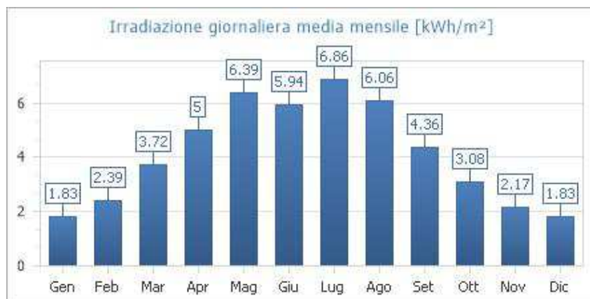
Fig. 1: Irradiazione giornaliera media mensile sul piano orizzontale [kWh/m²]

Quindi, i valori della irradiazione solare annua sul piano orizzontale sono pari a 1 363.00 kWh/m² (Fonte dati: UNI 10349:2016 - Stazione di rilevazione: Brindisi).